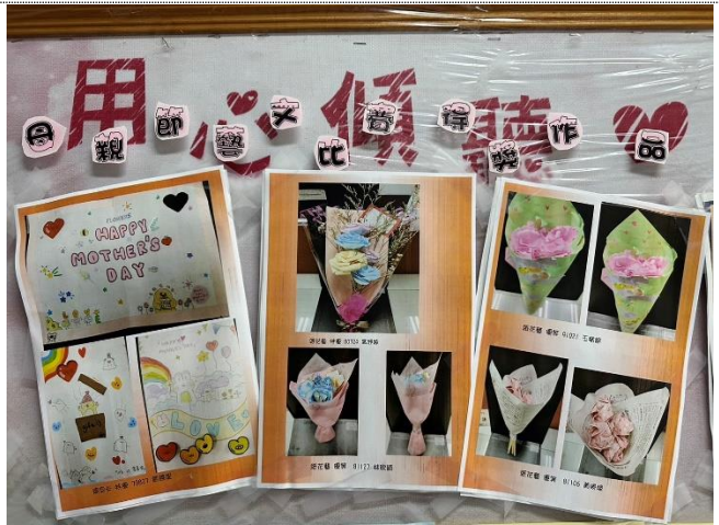
112 母親節藝文比賽-紙花藝與感恩卡作品，拍攝作品照片公告於輔導處布告欄和全校師生分享，作品則由學生帶回家送給家長。