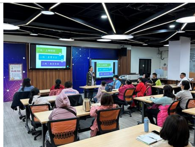
112-01 親職講座(四)提醒家長現今網路潛藏之詐騙、霸凌、性剝削、竊盜個資、金錢糾紛...等危機，務必留意孩子手機及網路使用狀況，注意安全。