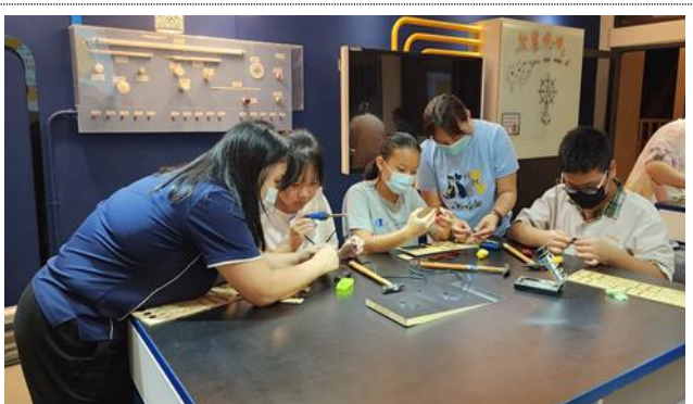
112-01 親職講座(一)邀請親子一同參與创客手作，培養溝通及問題解決能力，也讓家長看見孩子的亮點與能力，增進親子正向互動關係。