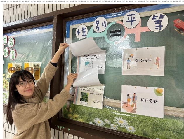
於輔導處布告欄宣導性別平等教育相關知識，112-02 討論分手、恐怖情人...等議題。