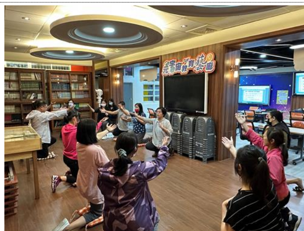
112-01 親職講座(二) Satir 溝通型態概念介紹與實際操作，覺察自己的溝通型態並學習較適當的人際、親子溝通方式。