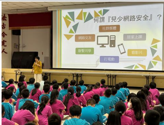
辦理新生始業輔導輔導處宣導-兒少網路安全及性剝削防治宣導，提醒學生留意網路使用安全及人際互動界線。