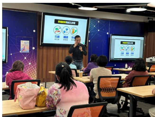
112-02 親職講座(三) 分享理財/金錢管理概念及如何從小培養孩子理財/金錢管理觀念。