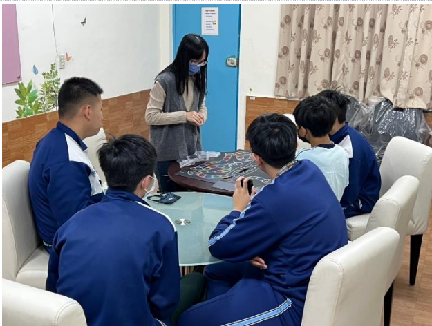
112-01 專輔教師帶領「與愛同行」-男生情感教育小團體，討論人際互動及性平議題。