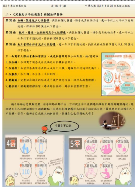
輔導處每月出版「走過青澀」刊物，橘子姐姐信箱模擬學生來信及回應，教導因應方式。