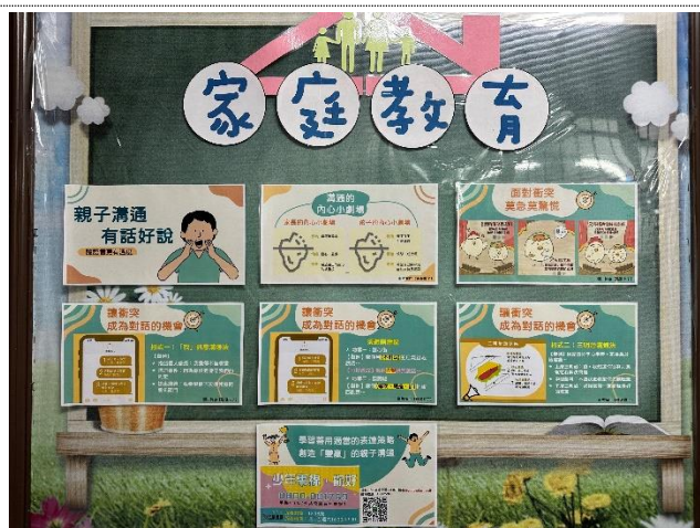
於輔導處布告欄宣導家庭教育相關知識，112-01 主題為親子溝通有話好說，並提供「少年專線」電話予學生有需要時使用。