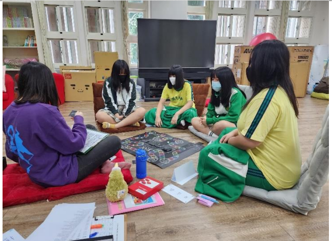
112-01 專輔教師帶領「練愛•戀愛」-情感教育小團體，以桌遊帶領討論戀愛與性議題。