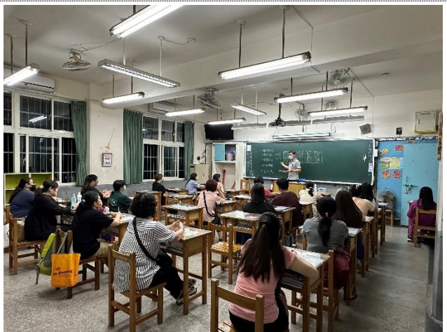
家長踴躍出席家長日，了解學生在校生活