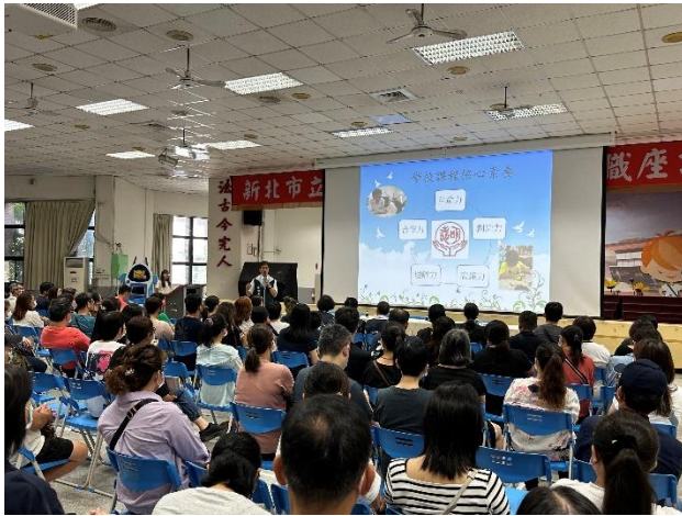
校長於家長日進行自我介紹及校務願景報告，並與家長交流、溝通