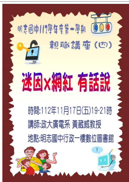
112-01 親職講座(四)宣傳海報