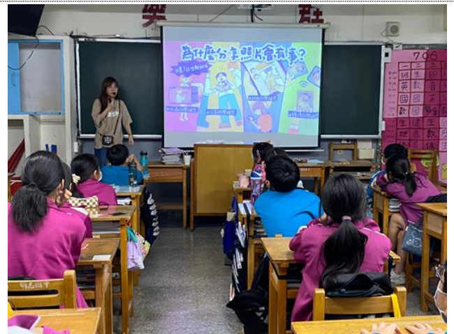
專輔教師至七年級各班進行「明志性平中學堂-小心轉傳變被告」入班宣導，提醒學生留意自身安全，注意日常人際互動界線。