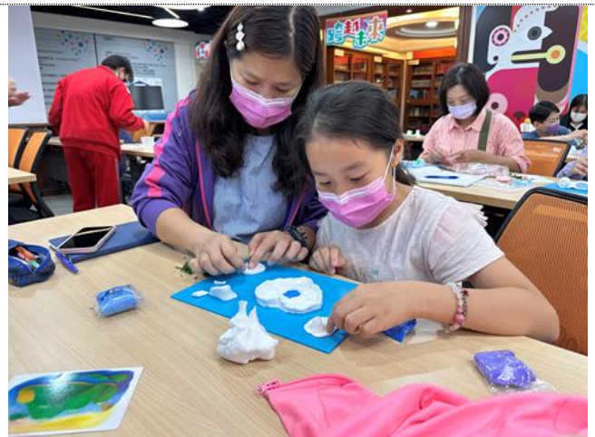
112-02 親職講座(四)透過藝術療癒放鬆身心，在實作過程中增進對自己 and 孩子的認識，也促進親子正向互動關係。