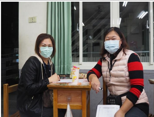
導師與家長討論、交流學生學習及生活狀況