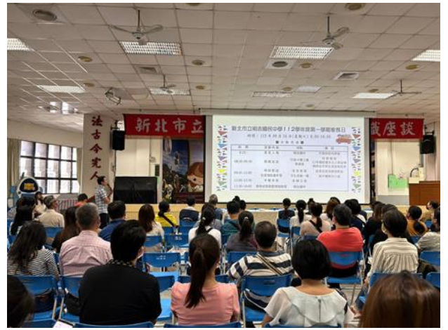
輔導主任於家長日宣導親職教育講座資訊，鼓勵家長踴躍出席參與