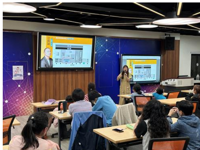
112-02 親職講座(二) 帶領家長了解孩子具備的能力，及如何陪同孩子討論生涯話題，並提供生涯規劃相關資源予家長和學生參考。