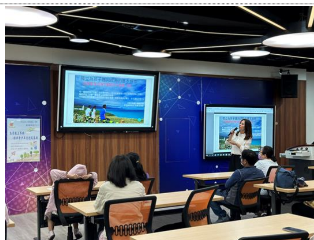
112-01 親職講座(三) 講師分享蒙特梭利教育親職教養觀點，鼓勵家長支持孩子探索自己的興趣和熱情所在，培養孩子們獨立自主的能力。