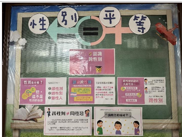
於輔導處布告欄宣導性別平等教育相關知識，112-01 討論跨性別議題。