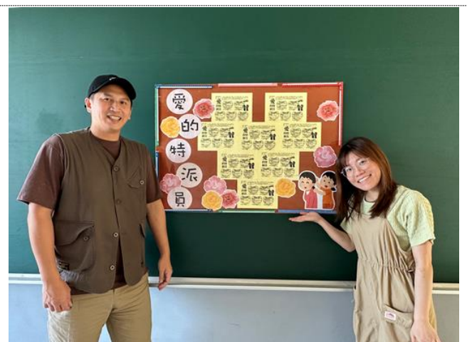
由專輔老師設計之 112 母親節感恩活動-愛的特派員活動單，作為校園藝術布置展示。