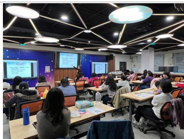
112-02 親職講座(一)了解阿德勒教養理論，協助家長建立愛與歸屬的家庭氛圍，並以鼓勵的語言支持與教養孩子。