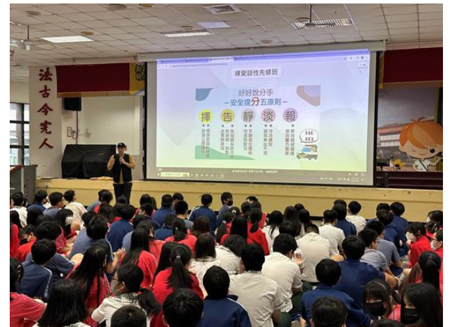
辦理九年級性別平等教育宣導講座「練愛談性先修班」，以遊戲互動方式，提醒學生留意性剝削、性行為安全及交往分手等議題。