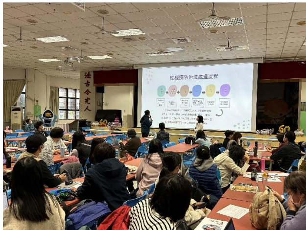
辦理教師寒假備課研習-教師的性別平等教育課-性侵害、性騷擾及性霸凌防治(含案例分享)，了解性平案件現況、預防及處理。