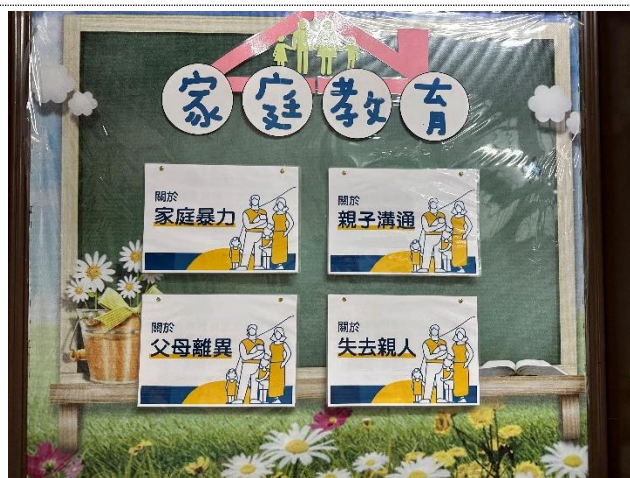
於輔導處布告欄宣導家庭教育相關知識，112-02 主題有：家庭暴力、親子溝通、父母離異及失去親人等學生會面臨的情形。