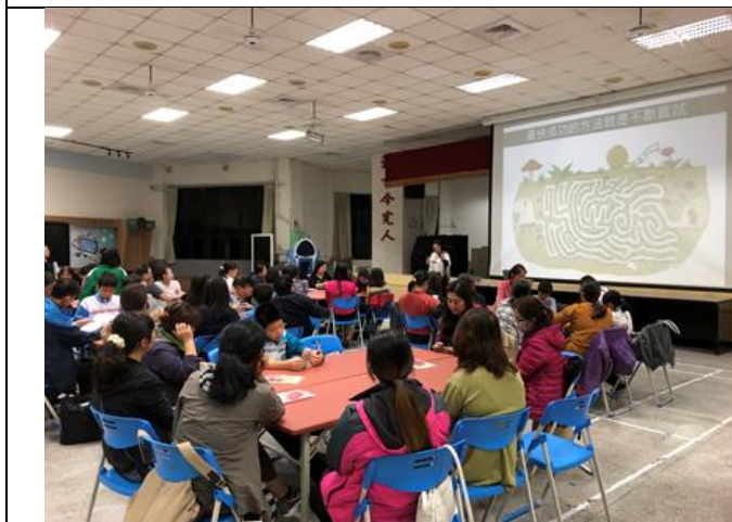
上學期親職講座(三)桌遊趣，親子同樂齊學習