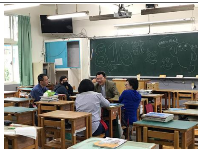
上學期家長日-班級懇親會