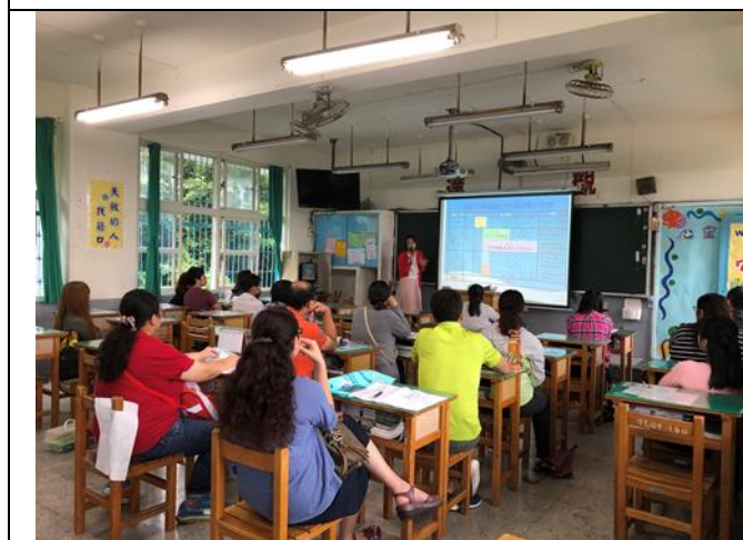
上學期家長日-班級懇親會