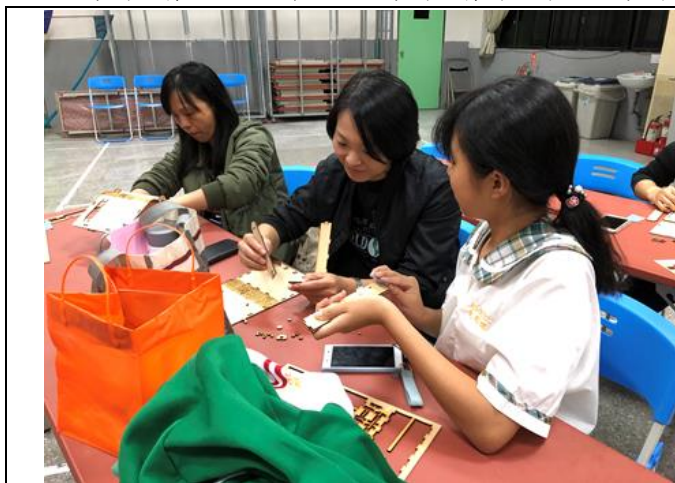
上學期親職講座(一)親子一同做「創客」