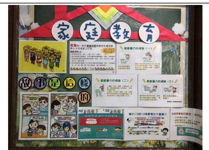
輔導處佈告欄家庭教育專區