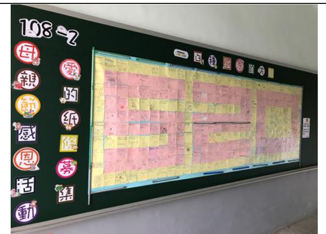
一百種感恩的方法愛的紙條募集活動裝置藝術