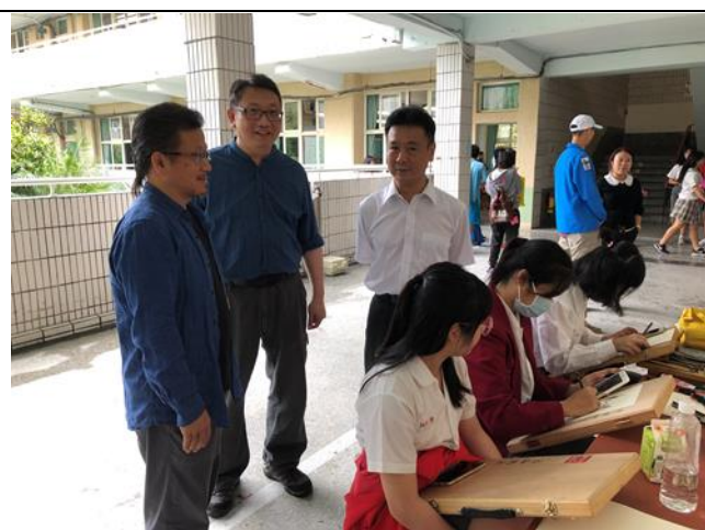
上學期家長日-生涯領航嘉年華

下學期家長日因新冠肺炎疫情關係，改採紙本及線上方式辦理，依舊製作並發放家長日親子手冊，並以 Google 表單及電話、通訊軟體等方式進行親師交流。