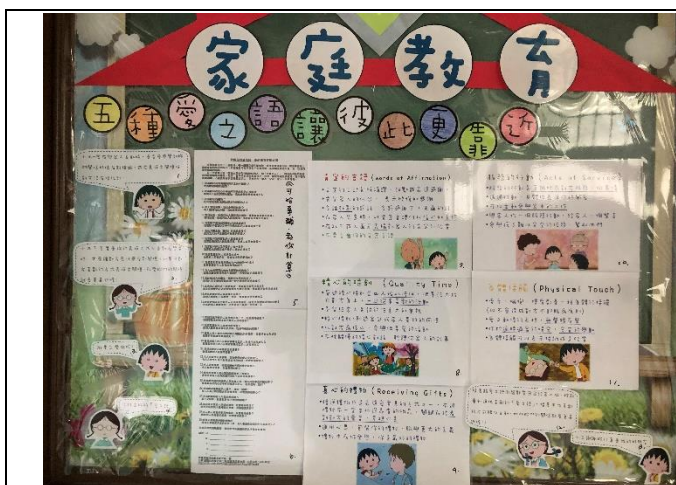
輔導處佈告欄家庭教育專區