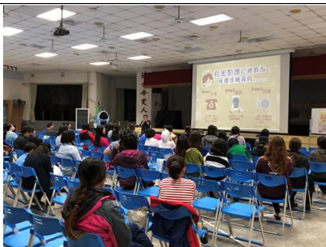
上學期親職講座(四)孩子愛低頭，家長要抬頭