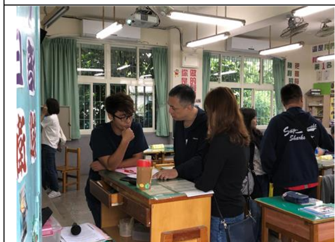
上學期家長日-班級懇親會