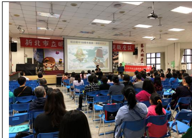
上學期家長日-親職座談

壹、家長日-親職座談、班級懇親會，親師交流，溝通、了解學生在家及在校情況。 全校教職員工及家長會長、家長會成員共同參與辦理。