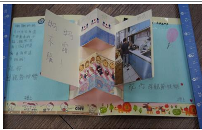
母親節藝文活動-感恩卡