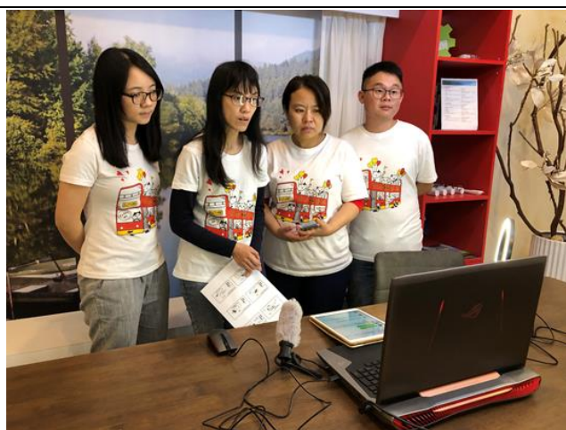
下學期親職講座-看懂孩子行為背後的意義

下學期親職講座因新冠肺炎疫情關係，改採線上直播方式辦理，調整辦理場次為三場，延後辦理一場次，並提前至 18:30 開播。親職教養不中斷，疫情也無法阻擋想要學習的熱情！線上直播零距離，讓更多的人可以一同參與，即時互動、回應！