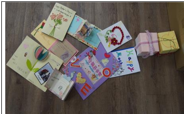
母親節藝文活動-感恩卡

參、母親節藝文活動比賽及一百種感恩的方法愛的紙條募集活動，回想主要照顧者對自己的好，以感恩的話語和行動表達對主要照顧者的感謝和感恩之情。