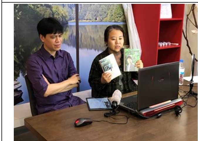
下學期親職講座-談親子關係的愛與界限