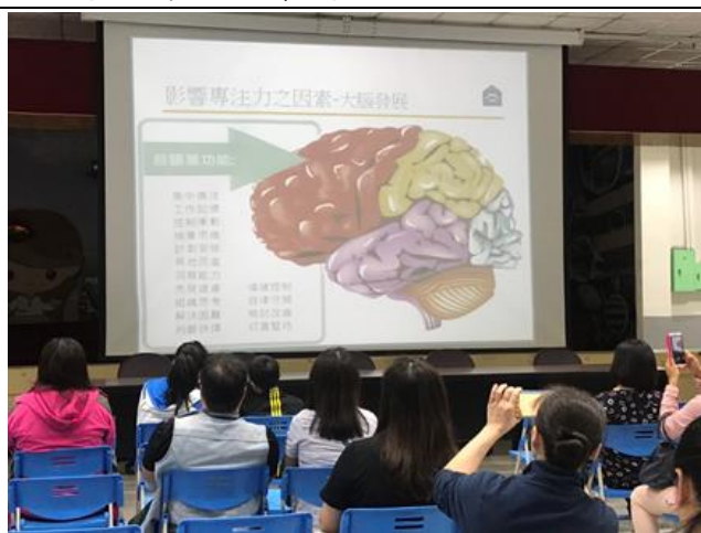
上學期親職講座(二)談國中生的專注力問題