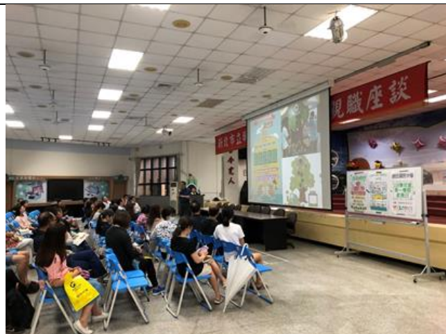
上學期家長日-親職座談