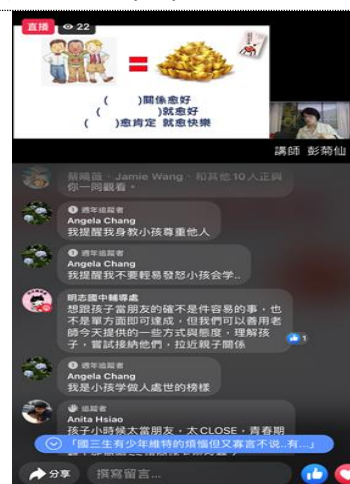
110-01 親職講座(二)直播與家長即時回應