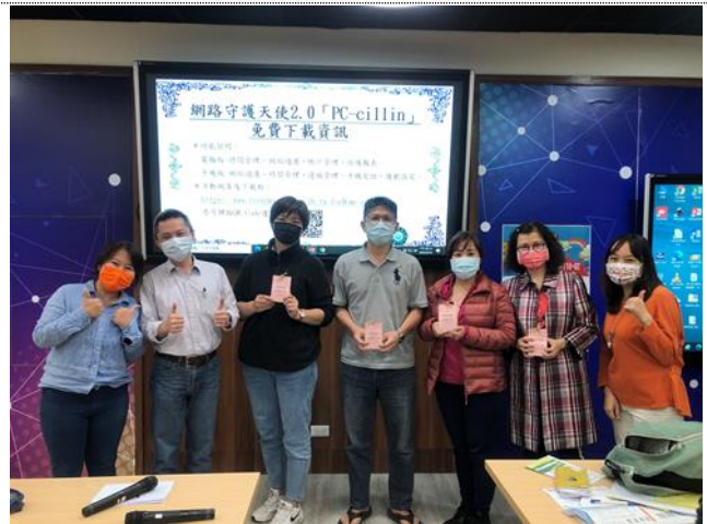
每一場親職講座，家長會副會長也都會報名參加，一同學習、宣傳家庭教育的重要性