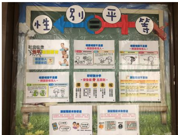
輔導處佈告欄宣導-如何好好說分手