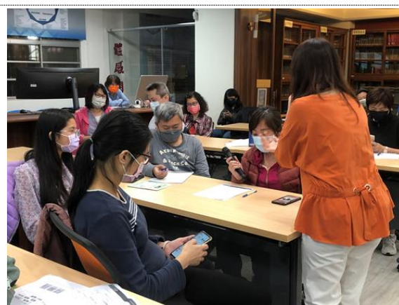
辦理「做情緒的主人」親職教育講座，有家長帶孩子一同來學習。