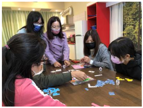
家分題桌遊分享-體驗家內任務分工，做家事、休閒活動等的重要性，連結家人關係