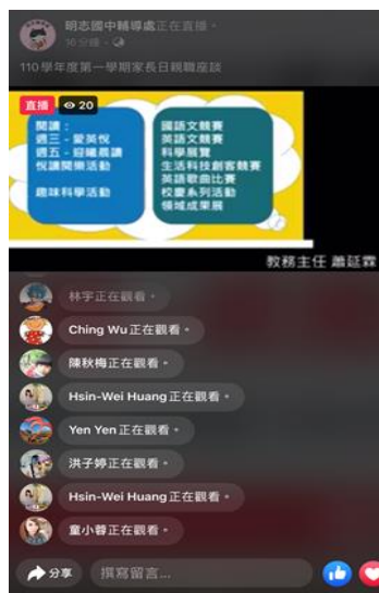
校務說明與介紹-讓家長了解學校活動