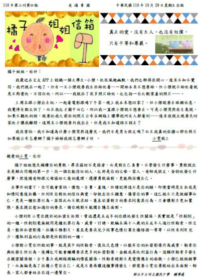
明志走過青澀刊物-橘子姐姐信箱宣導