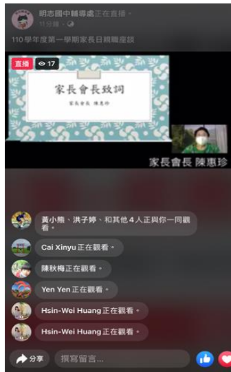
110-01 家長日，家長會長致詞勉勵