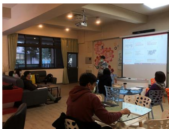
了解青少年憂鬱、自傷與拒學的原因，以及如何和家長及醫療等系統合作協助學生