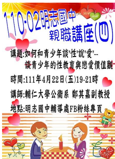
110-02 親職講座(四)宣傳海報