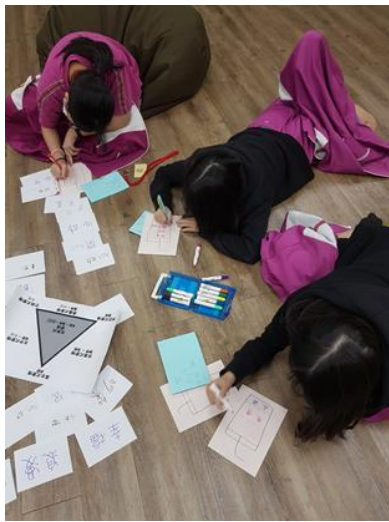
專輔教師辦理戀愛練起來-情感教育小團體