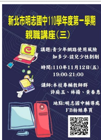
110-01 親職講座(三)宣傳海報