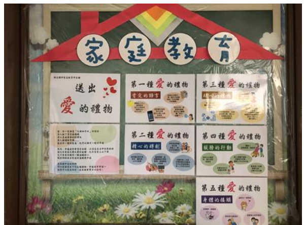
輔導處佈告欄宣導-五種愛的語言