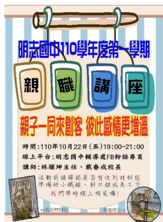
110-01 親職講座(一)宣傳海報