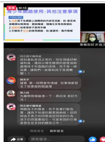
110-01 親職講座(三)直播並與家長線上互動