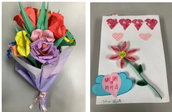
110 母親節藝文比賽-感恩卡、紙花藝 學生作品