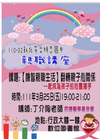
110-02 親職講座(二)宣傳海報