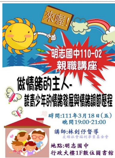
110-02 親職講座(一)宣傳海報