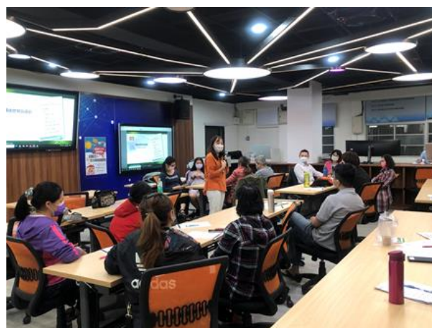
110-02 親職講座(一)親子一同參加講座