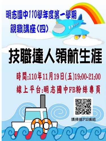
110-01 親職講座(四)宣傳海報