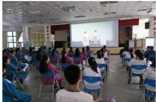
新北市中小學校園防範兒少性剝削宣導 -影片播放、簡報說明與有獎徵答