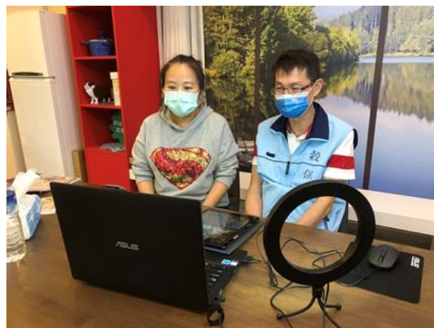
110-01 親職講座(四)直播現場