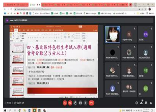
家長日親師懇談-導師說明升學管道、須留意和準備的事項，讓家長提前掌握升學資訊和資源，協助孩子適性生涯發展