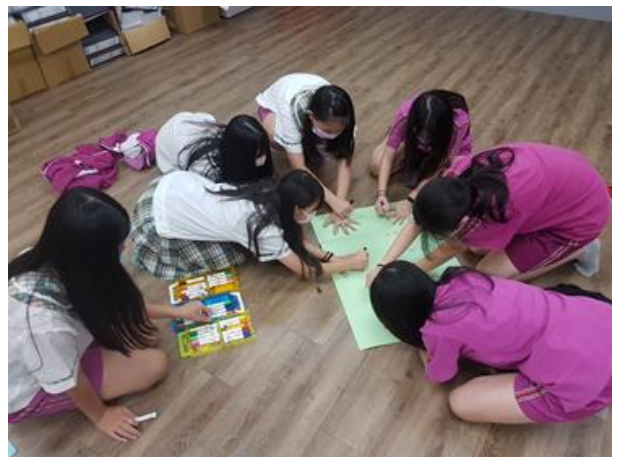
專輔教師辦理戀愛練起來-情感教育小團體