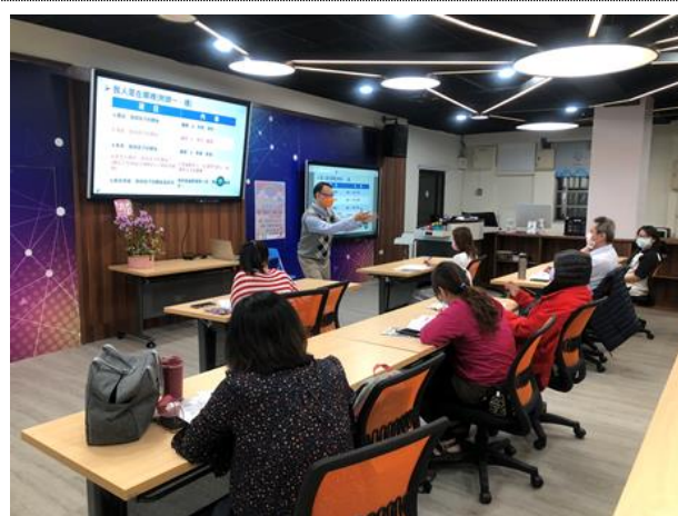
110-02 親職講座(二)講師與家長雙向互動