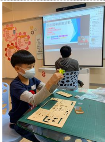
110-01 親職講座(一)線上直播與現場實作