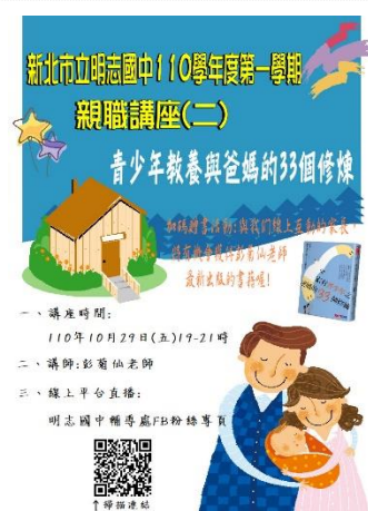
110-01 親職講座(二)宣傳海報