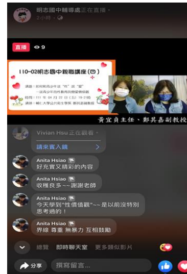
110-02 親職講座(四)家長回饋收穫良多