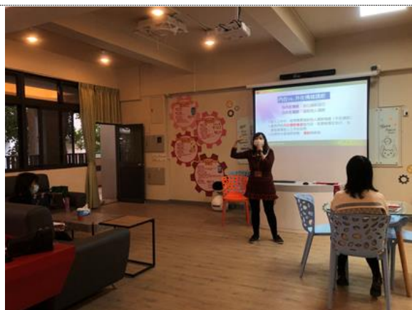
辦理兒少情緒教育與情緒調節概念和實務經驗分享教師自主研習，協助教師了解青少年情緒發展及如何幫助青少年調節情緒