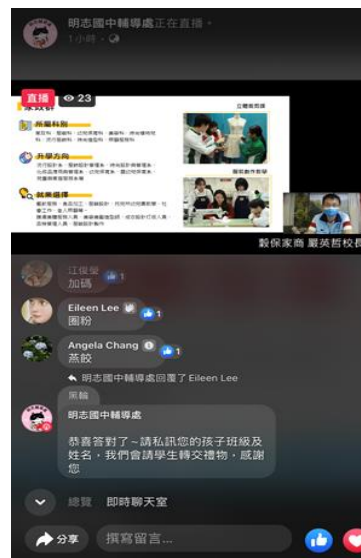
技職群科介紹讓家長了解生涯多元選擇