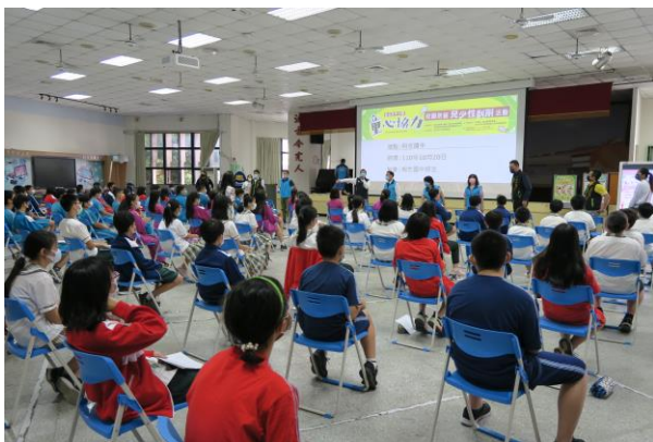
家長會連結資源，協助學校辦理童心協力-新北市中小學校園防範兒少性剝削宣導活動 活動開場