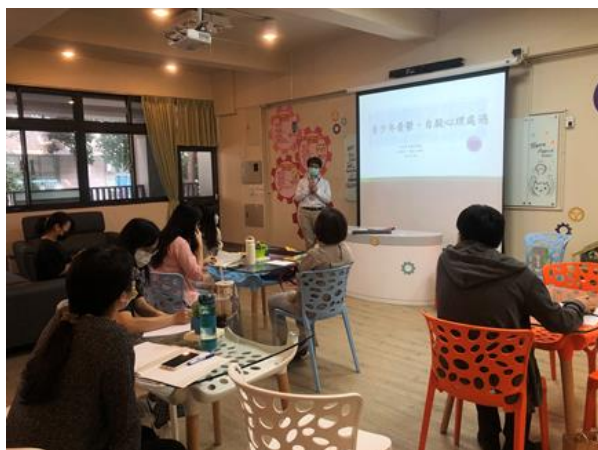
辦理處理青少年憂鬱、自傷與拒學之實務經驗分享和討論教師自主研習