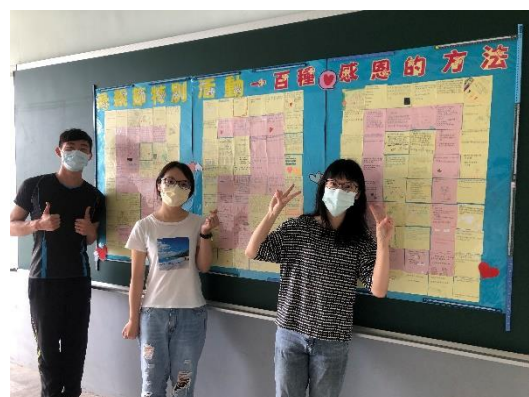
110 母親節感恩活動-愛的紙條 校園藝術布置展示