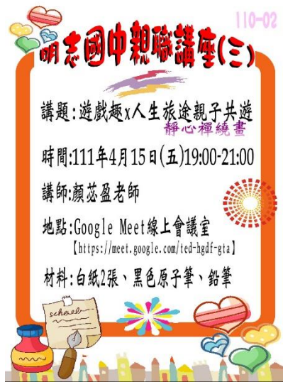
110-02 親職講座(三)宣傳海報