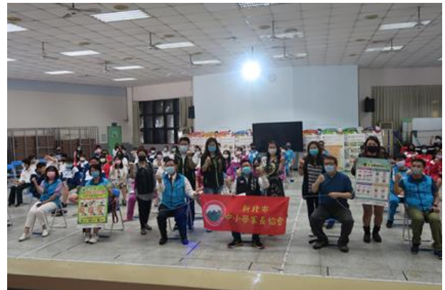
家長會連結資源，協助學校辦理童心協力-新 北市中小學校園防範兒少性剝削宣導活動 大合照