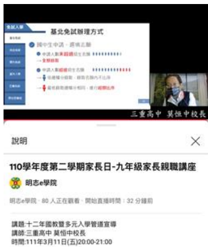
家長日親職座談-升學管道介紹，讓家長掌握升學資訊和資源，協助孩子生涯規劃