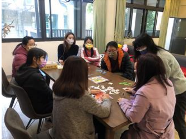
家分題桌遊分享-老師選擇自己想要扮演的角色、分享選此角色的想法