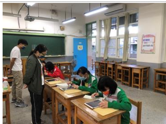
58 周年校慶各學習領域自主學習活動 綜合領域-性別平等智慧小學堂