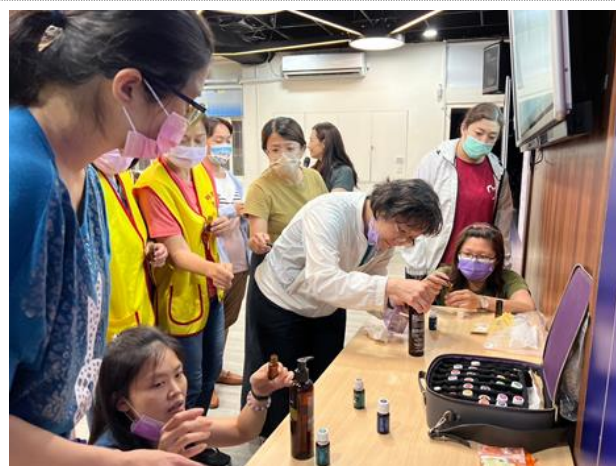
111-02 親職講座(四)讓每一位參與者都可以調製屬於自己的舒壓按摩油，學習精油使用基礎知識及簡易的按摩方法，在親職教養中也要適時照顧自己的身心健康、紓解壓力。