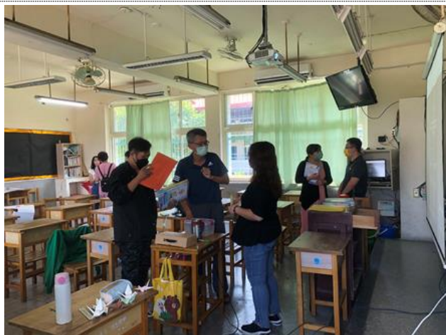
導師與家長、家長與家長之間進行交流