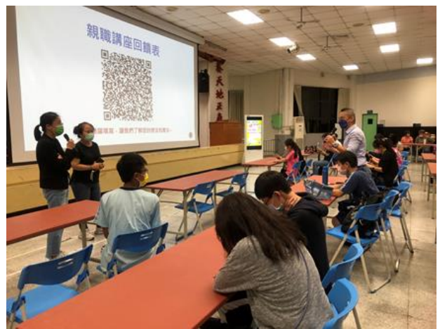
家長會副會長、委員們也都積極認真地參與學校辦理的親職講座，並會協助向其他家長推廣，邀請更多的家長一同來參與。