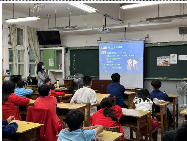
提供給資源班學生之性別平等教育宣導講座，提醒學生彼此尊重，也要懂得自我保護