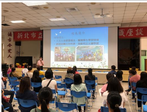
校長於家長日進行自我介紹及校務願景報告，並與家長交流、溝通