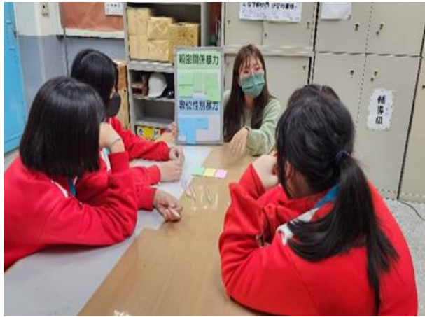
專輔教師辦理八年級女生「青春『戀』習曲-情感教育小團體」，協助學生澄清愛情價值觀，學習建立適當的親密關係互動方式。