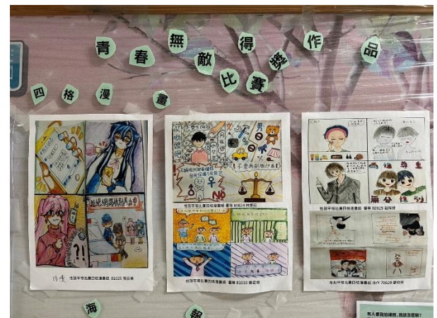
111 性別平等教育比賽-學生創作之四格漫畫作品，將作品拍照布置於公布欄分享。