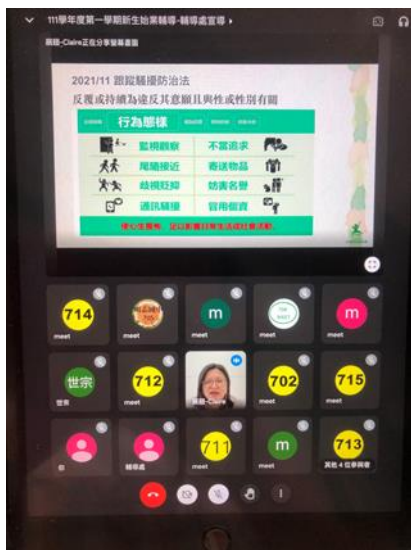
111 新生始業輔導-「網路安全知多少-張貼分享前想一想」，線上宣導。