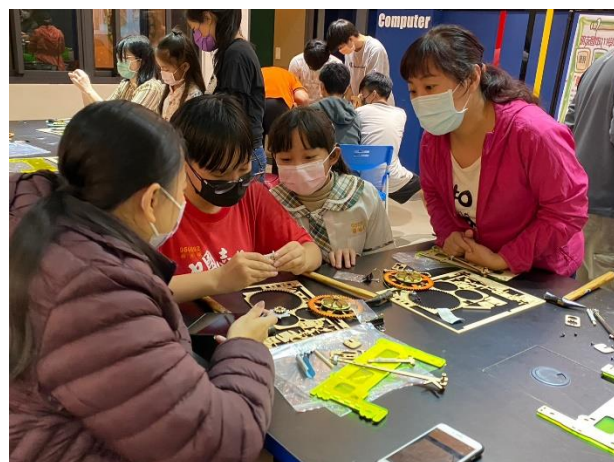
111-01 親職講座(一)藉由創客手作提供親子之間正向互動的機會，家長也藉此看見孩子的亮點，是既美麗又令人感動的時刻!