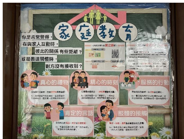
輔導處佈告欄宣導-五種愛的語言