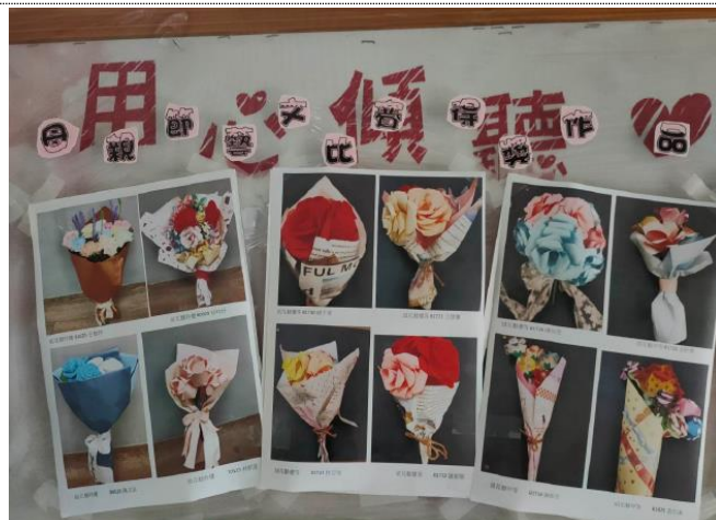
111 母親節藝文比賽-學生的紙花藝作品，拍攝作品照片公告於輔導處布告欄和全校師生分享，作品則由學生帶回家送給家長。