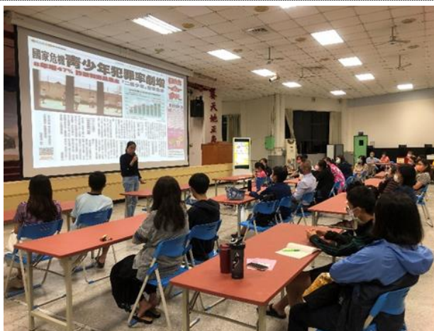
111-01 親職講座(四)吉官的演講吸引許多家長帶孩子一同來參加，家長也了解到注意孩子人際交友與網路使用安全的重要性。