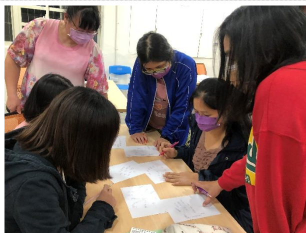
111-01 親職講座(二)邀請家長寫下自己對說謊行為的聯想並進行討論，了解行為背後的原因，協助家長重構對說謊行為的視框。