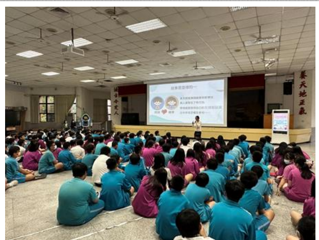
辦理九年級性別平等教育宣導-「青少年練『愛』工坊-青少年的愛與礙」