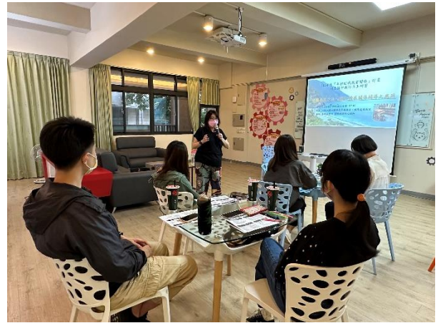
辦理教師「沙盤在青少年人際和情感關係輔導之應用(初階)」研習，學習沙盤治療運用方式，協助學生表達與學習適當的人際關係