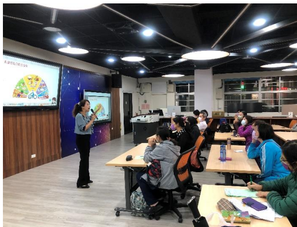
111-01 親職講座(三)家長踴躍參與親職講座，認真聆聽、寫筆記、提問，並與講師互動。