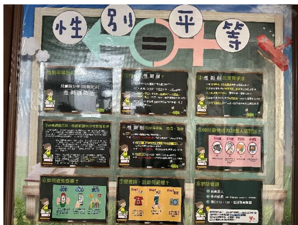
輔導處佈告欄宣導-性剝削防治