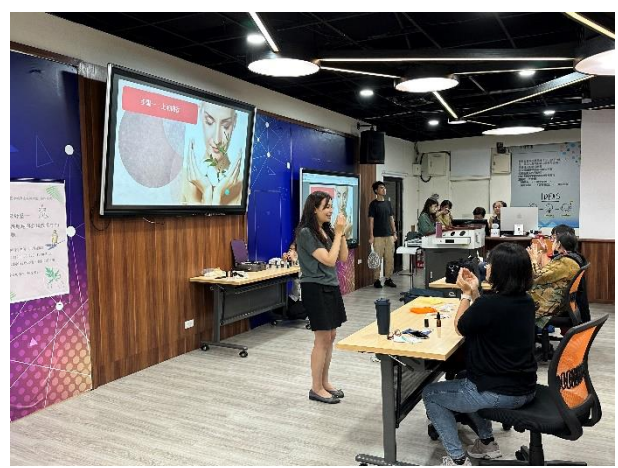
111-02 親職講座(四)講師帶家長及孩子一起透過嗅聞精油與按摩來抒解身心壓力。