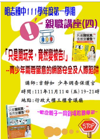
111-01 親職講座(四)宣傳海報