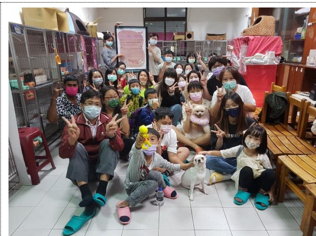
辦理友善動物-生命教育宣導活動，邀請社區家長與孩子一同來參加，參觀本校貓貓俱樂部、學習與貓狗互動，家長與孩子都很開心