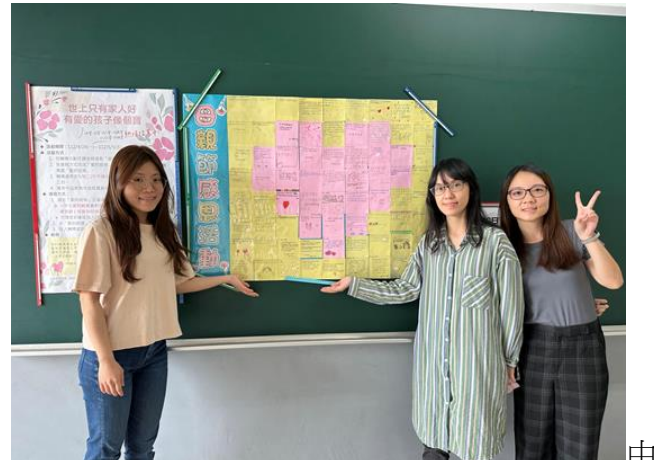
專輔老師設計之 111 母親節感恩活動-愛的紙條，作為校園藝術布置展示。