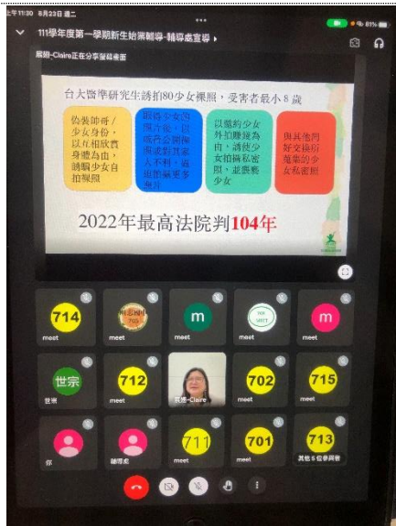
七年級新生「網路安全知多少-張貼分享前想一想」線上宣導，展翅協會陳處長分享性剝削防制資源(包含 i-win 網站、113 專線...等)