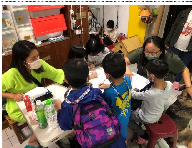
家長協助孩子書寫貓貓俱樂部參訪學習單，是家庭教育教養功能的展現。