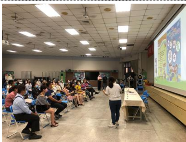
於家長日宣導家庭教育相關資源