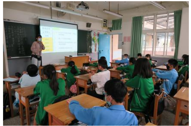
專輔教師於七年級各班進行 111「明志性平中學堂-只是摸一下，小心變被告」性騷擾防治宣導，藉由班級教學增進與學生之間的互動交流，亦可即時檢視學生的學習成效。