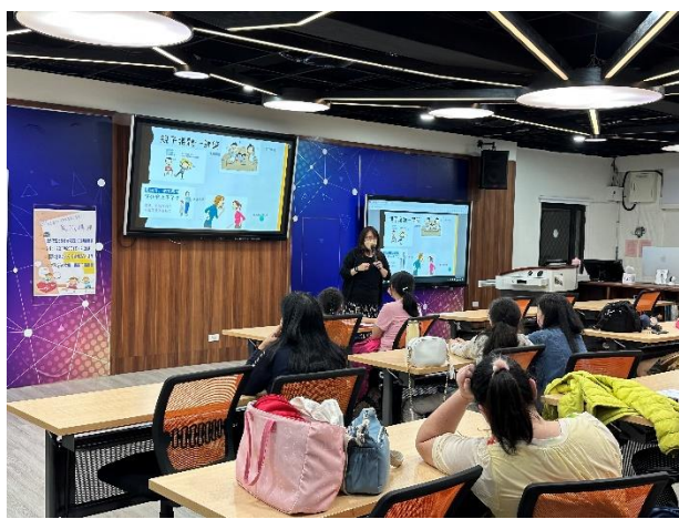
111-02 親職講座(三)介紹青少年發展議題與常見心理困擾，提供親職教養策略與方法。