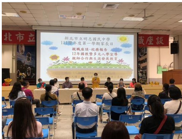
111-01 家長日，家長會長致詞勉勵