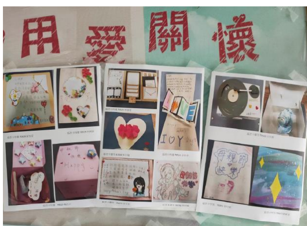
111 母親節藝文比賽-學生的感恩卡作品照片，實體作品則由學生帶回家送給家長。