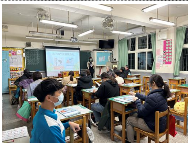
家長踴躍出席家長日，了解學生在校生活