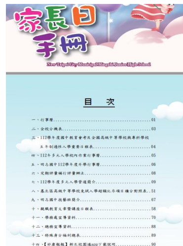
於家長日手冊進行相關資源宣導