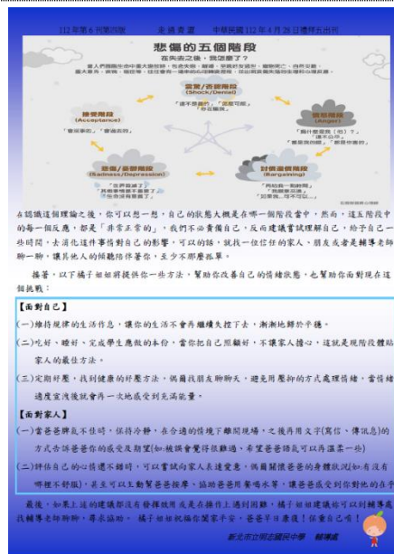
專輔老師針對學生常見困擾進行回應 (本篇文章與家庭、家人之間的相處有關)