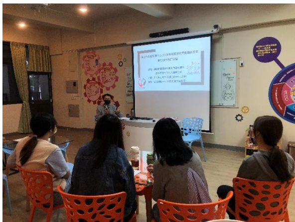
邀請新北市家防中心性保組蔡組長來和老師分享性行為人輔導策略並進行個案討論