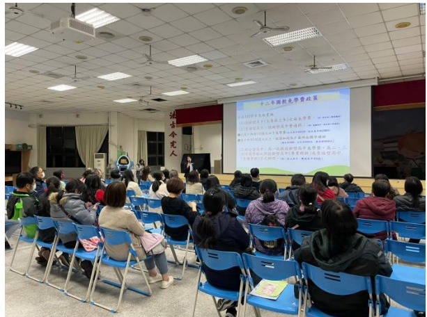
於 111-02 家長日辦理親職座談-「十二年國教暨多元入學管道宣導」講座，協助九年級學生家長了解孩子未來有哪些升學選擇與可使用之資源，一同幫助孩子做出合適的生涯發展規劃。