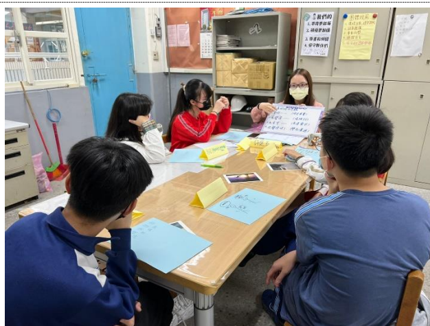
專輔老師帶領「幸福家油站」-自我與家庭關係探索小團體，教導學生適當的溝通技巧及五種愛之語，促進親子關係經營與修復。