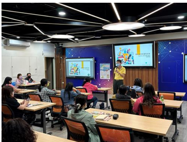
111-02 親職講座「生涯十字路口-幫助孩子做出適性生涯選擇」，了解高職群科與選擇